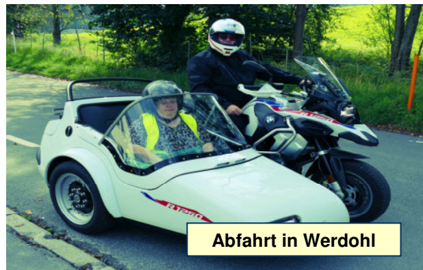
Abfahrt in Werdohl

Das Gespannfahren 2026 findet zusammen mit dem Werkstattfest statt auf dem Gelände vom Ev. Johanneswerk gGmbH | Studjo Gewerbestr. 10 58791 Werdohl Kettling Sie Erreichen die Werkstätten über die A45,